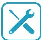
Boîte à outils

Les vidéos sont des rushs pour que vous puissiez réaliser vous-même vos montages Tiktok – Instagram;